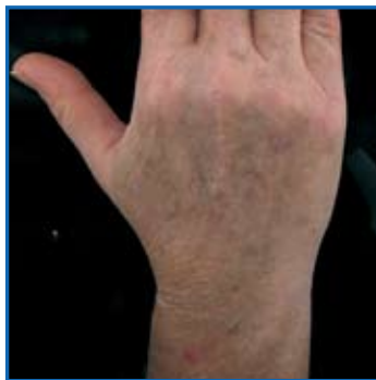
Follow up a 1 settimana dalla 3 a seduta