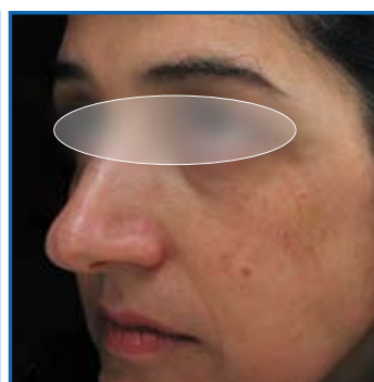
Follow up a 1 settimana dalla 3 a seduta