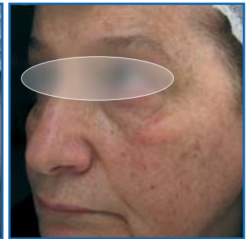
Follow up a 1 settimana dalla 2 a seduta