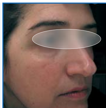
Follow up a 1 settimana dalla 3 a seduta