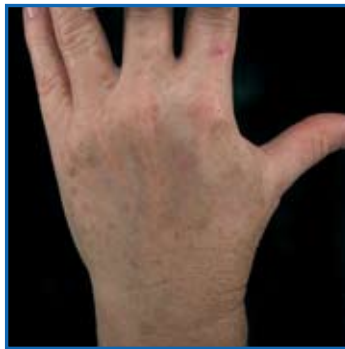
Follow up a 1 settimana dalla 3 a seduta