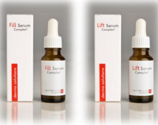
dermenergy Serum Complex