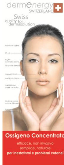
Standardo autoportante da cm. 200 x cm. 80