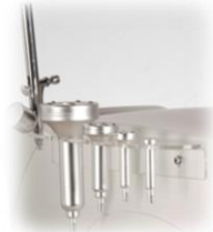
Manipoli Ossigenazione Profonda e Perfusione