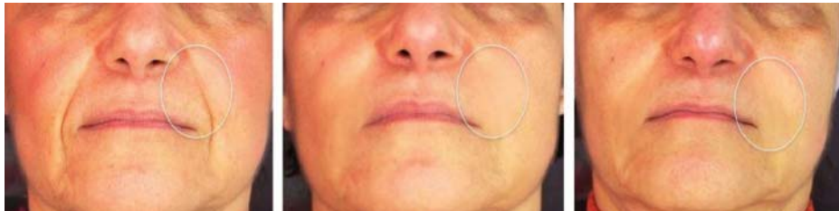
Fig. 4 - Rughe naso-geniene, molto profonde, trattate con ST Pre-trattamento, dopo il trattamento e dopo 18 mesi

La seduta ha una durata di circa 15 minuti, e si può ripetere la settimana successiva con il solo filler solo se occorre eseguire