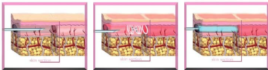
Fig. 1 - Inserzione dell'ago nel derma; Fig. 2 - Rotazione a 360° in modo da creare un canale virtuale. Tale procedura si attua con tecnica retrograda; Fig. 3 - Senza mai uscire dal sito d'iniezione l'ago ripercorre il tragitto rilasciando acido ialuronico con tecnica lineare retrograda

Da diversi anni ormai il medico estetico, utilizza la tecnica riempitiva mediante filler, la biorivitalizzazione e la radiofrequenza. I filler più diffusi sono quelli riassorbibili a base di acido ialuronico le cui proprietà sono ormai ben note. I biorivitalizzanti apportano invece sostanze nutritive (aminoacidi, vitamine, nucleotidi, acido ialuronico, antiossidanti) di cui la cute necessita per la sua naturalezza, giovinezza ed idratazione. Entrambi, però, hanno relativamente "vita breve", e da qui è nata l'intuizione di una combinazione fra queste metodiche di più largo impiego: la radiofrequenza intradermica (medium frequency) emessa da un nuovo dispositivo denominato Spherofill Tactics (ST), e le sostanze a carattere riempitivo o rivitalizzante, per il ringiovanimento del volto, per la cura delle depressioni facciali e delle strie distense, al fine di ottenere effetto "long lasting" ma oggi anche un effetto rivolumizzante e rigenerante delle aree trattate.